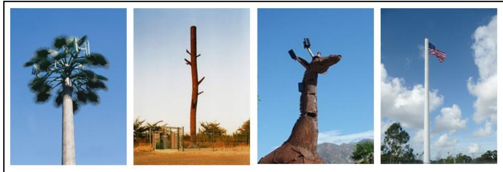
Gambar 2.1. Contoh concealed design menara telekomunikasi

tersamarkan dengan lingkungan sekitarnya. Konstruksi ini dipersyaratkan karena bangunan menara yang “telanjang” dianggap mengganggu estetika visual (Lihat Gambar 2.1).