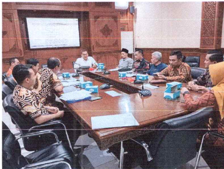
FOTO DOKUMENTASI RAPAT PANSUS II DENGAN TIM KOORDINASI RAPERDA TINGKAT KOTA SALATIGA TERKAIT RAPERDA PENYELENGGARAAN PERIJINAN BERUSAHA TANGGAL 02 JANUARI 2024